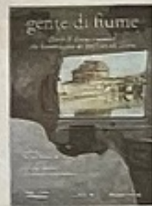
Cover Il libro Gente di Fiume (Palombi Editori, 170 pagine, 18 euro) curato dallo scrittore Stefano Brusadelli, con testi redatti dagli studenti della Luiss

Ecco alcuni dei personaggi del libro Gente di Fiume (Palombi Editori, 170 pagine, 18